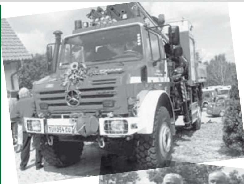
Segnung des neuen Feuerwehrautos