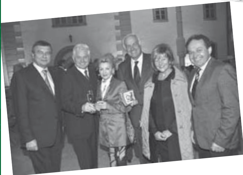
Eröffnung Schloss Weitra Festival