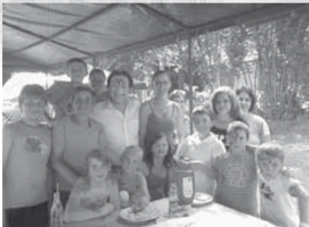
Abschlussfest im Kindergarten Kalvarienberg